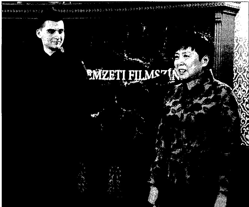
▲ 高建大使（右）在VIP酒会上致辞。